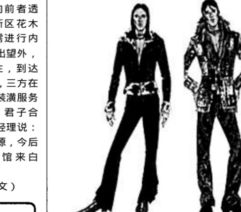
关键细节 拼贴 / 彩色蛇皮 / 皮革贴花的牛仔服 / 马皮镶边 / 毛边的皮革牛仔服 / 毛皮镶边 / 解构式裁剪 / 仿蜥蜴皮印花塑料 / 缩绒针织物

便装 活泼的都市运动服在新千年将继续影响男装的廓型，但诠释的方法有所变化，如采用牛仔面料和天然毛皮，使服装看起来像喜爱的常穿之物；休闲装多为解构、堆砌和摇滚风格，但轮廓偏瘦，不像运动装那样宽松；本季男装色彩丰富，面料肌理和细节设计不同寻常，整体感觉豪放狂野。