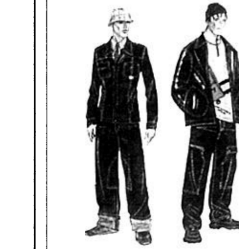
关键细节 类似工装的细节设计 / 合身的牛仔套装 / 宽腿裤 / 合身上装 / 滑雪服的细节 / 折缝的氯丁橡胶 / 弹力羊毛面料 / 细小的商标标牌