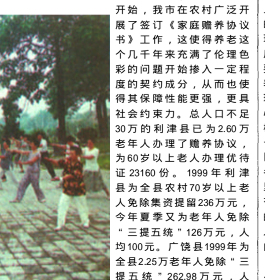
我市目前共有敬老院54处，集中供养老年人1486人。在这里边，有省级模范敬老院6处，市级模范敬老院8处。广饶县大王镇投资340万元建起的具有较高水平的幸福公寓更成为了老年人生活的乐园。

在农村，养老问题也得到了大幅度的改善。除了从政策上对老年人进行不同程度的倾斜之外，一些经济条件比较好的村子已经开始尝试实行老年农民退休、发放一定生活补贴、社会供给等各种新办法，在老年人当中，乃至在整个社会上引起了强烈反响。1994年，我市出台了对于70岁以上老年人的优待照顾政策，全市统一印制并颁发了《老年人优待证》，70岁以上老年人凭优待证在就医、乘车、游览、娱乐等诸多方面享受优惠。特别是对农村70岁以上老年人免除拘留和乡统筹受到了农村老年人的普遍欢迎。从九十年代开始，我市在农村广泛开展了签订《家庭赡养协议书》工作，这使得养老这个几千年来充满了伦理色彩的问题开始掺入一定程度的契约成分，从而也使其保障性能更强，更具社会约束力。总人口不足30万的利津县已于2.60万老年人办理了赡养协议，为60岁以上老人办理优待证23160份。1999年利津县为全县农村70岁以上老人免除集资提留236万元，今年夏季又为老年人免除“三提五统”126万元，人均100元。广饶县1999年为全县2.25万老年人免除“三提五统”262.98万元，人均免除123.80元；今年上半年为新进60岁的老年人办理优待证2050份。