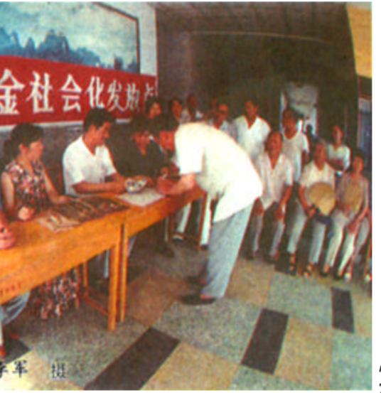
点不超过一公里，保证每领取一笔养老金不超过5分钟；保证困难企业的离退休人员的养老金发放及时、足额，做到一分不少，一个不漏；保证让年龄大、身体有病、行动不便的企业离退休人员足不出户就能领到养老金，社会保险机构安排专人或委托企业保险业务员每月按时将养老金送上门。

在城镇，各行政和企事业单位的离退休职工一直得到政府的关怀。而近年来备受社会关注的企业离退休人员养老问题也得到了很大程度的改善。我市自1987年开始对企业离退休人员养老金实行以市为单位的统筹，基本解决了由于企业经营状况原因造成的养老金待遇苦乐不均问题。1992年，我市又在全省率先推行了养老金社会化发放，截至今年6月30日，全市企业离退休人员养老金社会化发放已经全部覆盖发放范围内的7264名离退休人员，月发放养老金398.6万元，发放率达100%。负责这项工作的市社会保险事业处还就养老金发放问题作出了四项承诺：保证每月10日之前将养老金按时足额发放到每一位离退休人员手中，发放准确率100%；保证每一位企业离退休人员居住地养老金发放