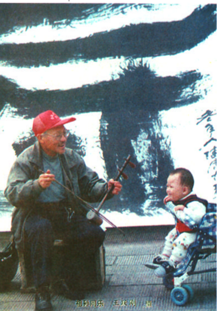
尊老敬老是我们中华民族的传统美德。作为社会伦理道德的一个重要组成部分，千百年来尊老敬老一直受到人们的普遍关注，并作为道德评价的一个尺度为大家所运用。不管是家庭内部的“孝”，还是推而广之的“老吾老以及人之老”，都能充分体现出我国古代的哲学家、思想家以及受他们影响的社会领域内的大多数人对尊老敬老思想的普遍认同和努力实践。而在我国历史朝代的文学作品当中，尊老敬老也是一个备受世人关注的主题。尊老敬老也是一个人物形象便成了正反两个方面的代名词。前者如孝行感天的虞舜、扇枕温席的黄香、纳履桥下的张良，后者如《墙头记》中的大乖、二乖，他们的故事（好的、坏的）为人民群众耳熟能详。

者在一辆公交车上曾经见到一位男青年领着一位白发苍苍的老太太乘车，因为没有座位，司机几次按下语音信箱的按钮，提醒大家给这位老太太让座。可惜一直无人响应，最后那位男青年非常生气地站在她身边的记者说，以后碰到这种情况，我也不给别人让座了！我家的老人得不到别人尊重，我很伤心……男青年说的当然是一句气话，但也折射出一个潜在的深层次问题：真正形成一种“老吾老以及人之老，幼吾幼以及人之幼”的良好风气不是一天两天的事，这需要全体社会成员共同努力，需要形成一种稳定的良好的舆论氛围。